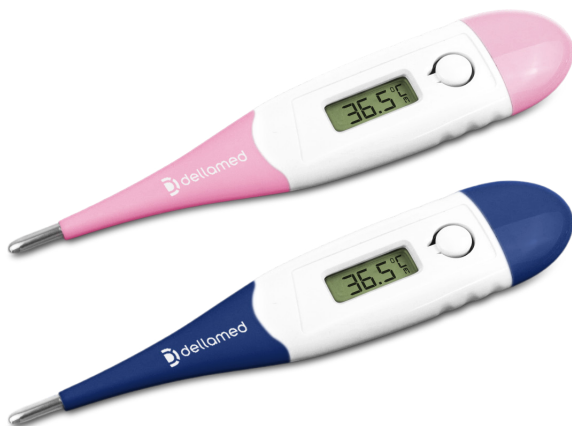
Termômetro Clínico com haste Flexível