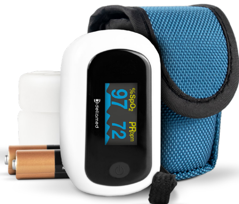
Oxímetro com alarme