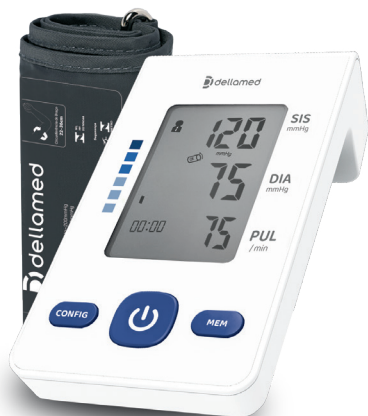
Monitor de pressão Max