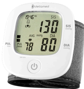
Monitor de pressão Super